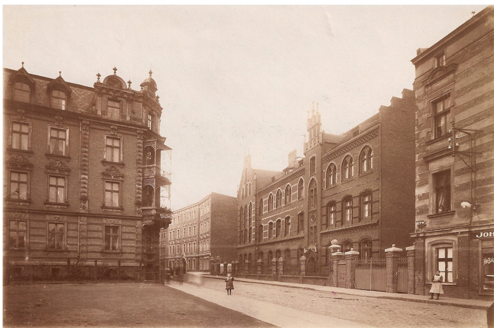
Ulica św. Barbary w I ćw. XX w.