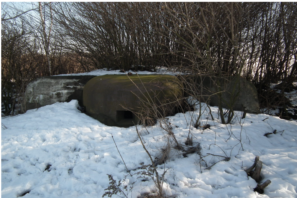
Schron bojowy na terenie Michałkowic

Na terenie pól uprawnych na południe od ulicy Frenzla (wzgórze 304,7) znajdują się dwa polskie schrony Obszaru Warownego "Śląsk" z lat 30. XX w. Na wschód od nich znajdują się dwa schrony wartownicze na terenie byłej kopalni "Michał" i jeden schron wartowniczy na terenie szybu północnego przy ul. Bytomskiej. Jeszcze jeden schron wartowniczy znajduje się przy ul. Krupanka. Stan zachowania: schron z Obszaru Warownego "Śląsk" jest systematycznie podtapiany. Schrony przy ul. Bytomskiej i Krupanka są zabezpieczone (w obrębie posesji) i we w miarę dobrym stanie, podobnie schrony na terenie byłej kopalni "Michał".