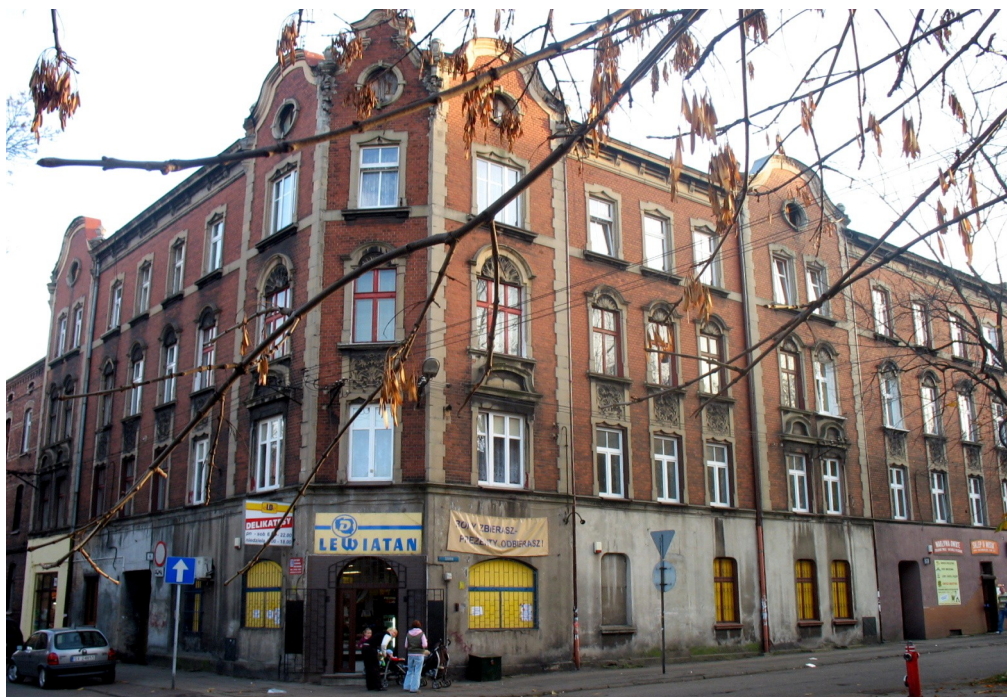
Kamienica przy ul. Szkolnej 1