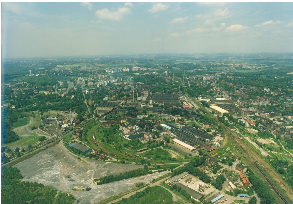
Fabryka Elementów Złącznych (rejon ulic Głowackiego, Matejki, Fabrycznej)