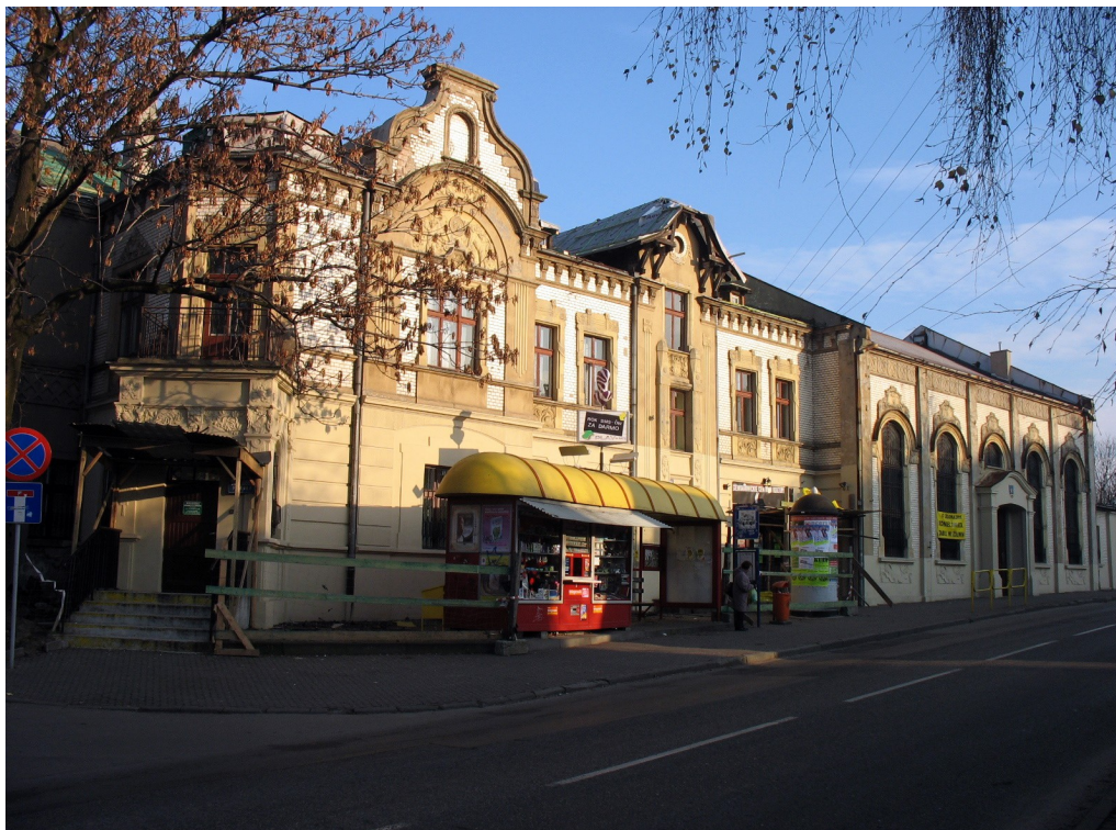
Siemianowickie Centrum Kultury przy ul. Niepodległości 45

Ufundowana przez Spółkę Akcyjną Zjednoczonych Hut Królewskiej i Laury w 1908 r. dla pracowników huty "Laura". Projekt wykonał budowniczy Emil Twrdy z Pszczelnika. Budynek z czerwonego klinkieru z białymi elementami zdobniczymi. Rozbudowany (przedłużony) w latach 70. XX w. przy czym usunięto wówczas szatnie znajdujące się na emporze. Usytuowany na obrzeżach zabytkowego parku „Hutnik”. Wyremontowany wewnątrz pod koniec XX w. i przywrócony do użytkowania.