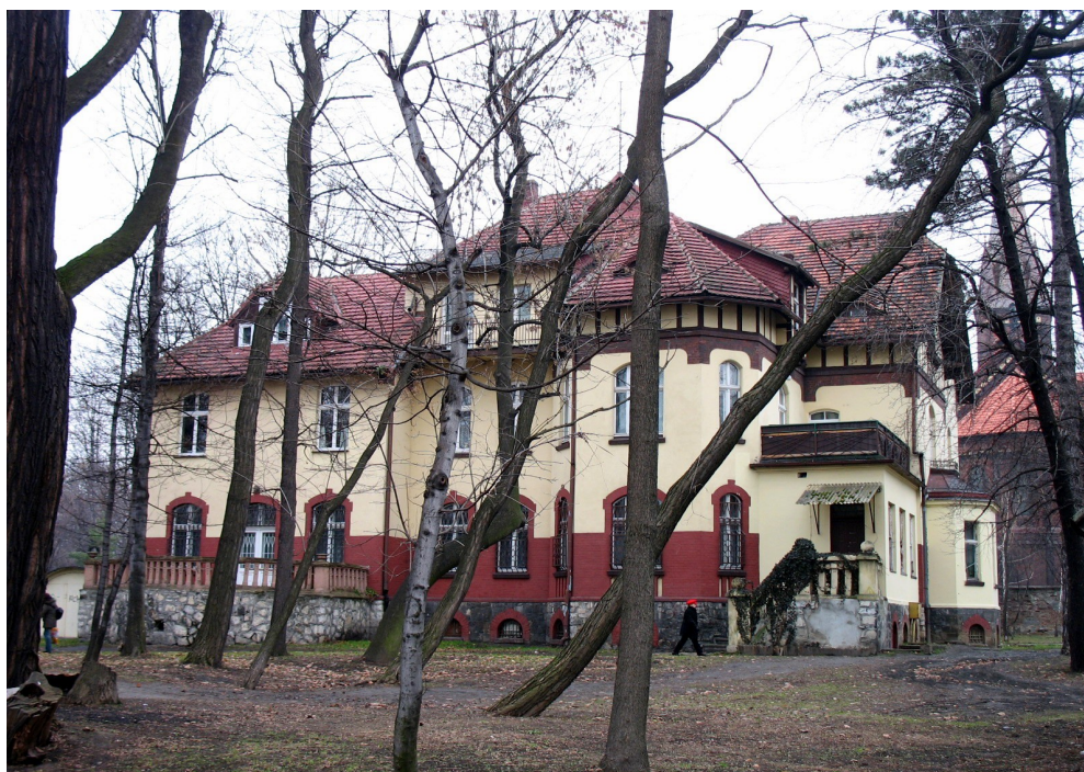
Willa przy ul. Oświęcimskiej 2

34. Wille przy ul. 1 maja 3, 5 – nr 3 własność prywatna; właściciel od lat nie użytkuje budynku, który niszczeje; nr 5 wpisana jest do rejestru zabytków i wykonano remont wnętrza.