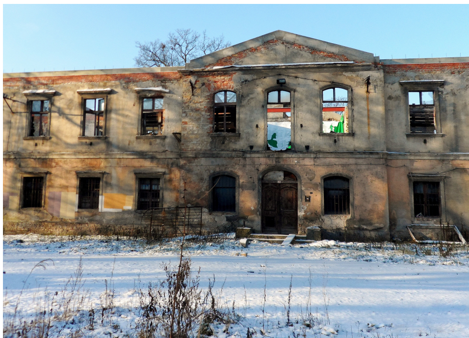
Zachodnie skrzydło pałacu Donnersmarcków. Stan z grudnia 2014 r.