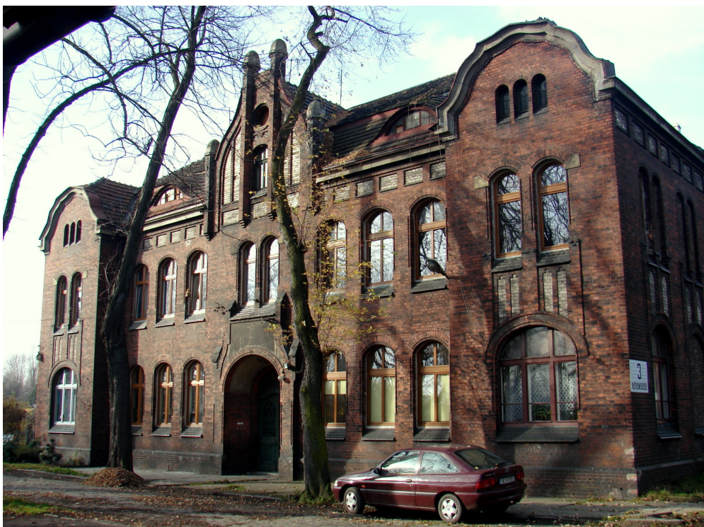
Dawny budynek administracji kopalni "Laurahuta" (rejon Ficusus)

7. Browar: objęty w zapisach aktualnie obowiązującego planu zagospodarowania przestrzennego ścisłą ochroną konserwatorską. Zakupiony przez prywatnego właściciela. Bez zgody Wojewódzkiego Konserwatora Zabytków zlikwidowana została linia produkcyjna browaru. Budynek restauracji został wyremontowany i przywrócono jego funkcję mieszkalną. Obecny właściciel zamierza pozostałe budynki browaru (produkcyjne) zaadaptować na lofty.