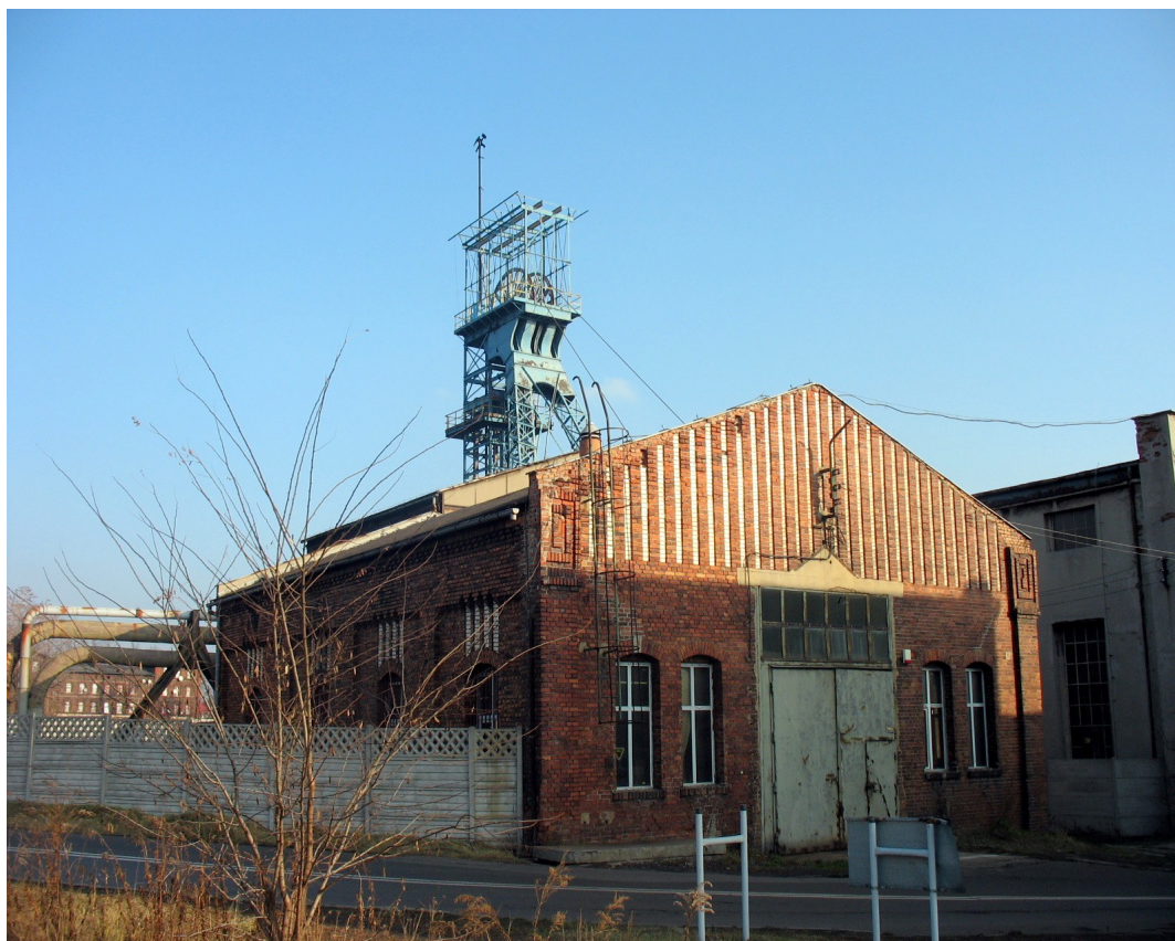
Zabudowa w rejonie ulicy Olimpijskiej (tereny byłej kopalni Richter)