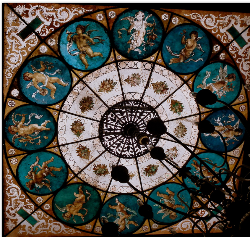
Świetlik w sali reprezentacyjnej willi Fitznera