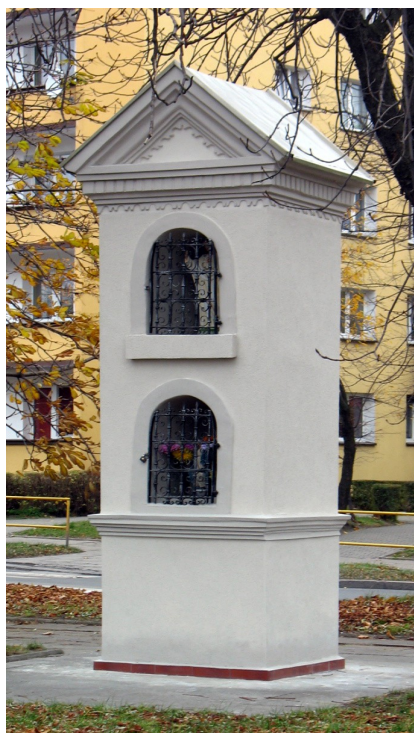
Kapliczka słupowa z ok. 1880 r. przy ul. Elizy Orzeszkowej

kilkanaście metrów z powodu realizacji nowych inwestycji. Część odnowili mieszkańcy (np. kaplicę św. Izydora w Przełajce). Staraniem władz miasta w latach 1998-2011 została odnowiona większość kapliczek i krzyży zlokalizowanych się na gruntach należących do gminy.