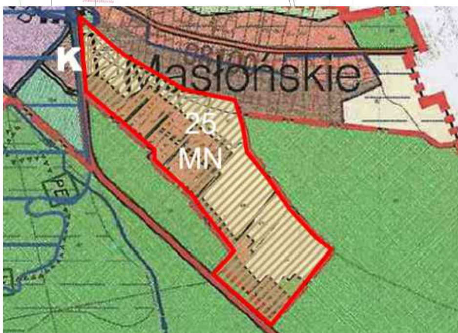
WYRYS ZE STUDIUM UWARUNKOWAŃ I KIERUNKÓW ZAGOSPODAROWANIA PRZESTRZENNEGO GMINY PORAJ SKALA 1 : 10 000