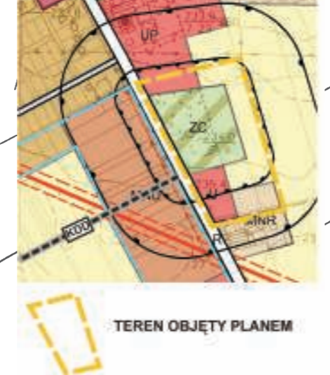
WYRYS ZE STUDIUM UWARUNKOWAŃ I KIERUNKÓW ZAGOSPODAROWANIA PRZESTRZENNEGO GMINY KŁOBUCK SKALA 1 : 10 000