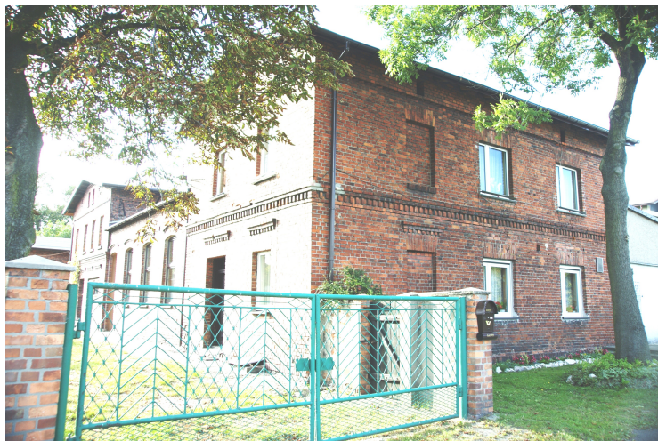
Dawna karczma z końca XIX w.

Nazwa Ligota wiąże się z kolonizacją ziem i zakładaniem lub reorganizacją miejscowości na tzw. prawie niemieckim. Mieszkańcy byli wtedy zwolnieni przez określoną liczbę lat z płacenia podatków. Pierwsze wzmianki o Ligocie Woźnickiej