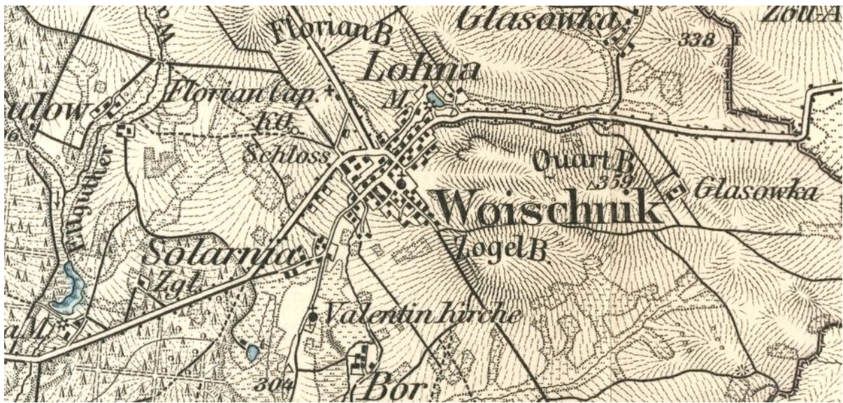
Widok Woźnik na fragmencie mapy "Karte des Deutsches Reiches, nr. 479" z 1893 roku, skala oryginału 1 do 100000.

Woźniki posiadają średniowieczny układ urbanistyczny ukształtowany prawdopodobnie w wyniku lokacji na przełomie XIII i XIV w, ponieważ nie jest znana dokładna data lokacji nowego miasta. Układ przestrzenny, chroniony wpisem do rejestru zabytków. Ze źródeł historycznych wiadomo, że w okresie późnego średniowiecza miasto stanowiło osadą otwartą, nie posiadającą murów, baszt i bram. Jedyne miejsce umocnione było grodzisko, tzw. stare miasto Woźniki. Trudno jednak określić wielkość Woźnik z tego okresu. Miasto, które obejmowało okoliczne wsie, kuźnie, warzelnie soli, pod koniec XVIII wieku ogranicza się prawie wyłącznie do samego miasta. Bezpośrednie zaplecze uległo zawężeniu na skutek wydzielenia nowej jednostki administracyjnej Łany (Lohna). Pod koniec XVIII wieku w wyniku reformy Fryderyka II Wielkiego miasto zostało zdegradowane do osady targowej „marktflecken”. Odzyskanie przywilejów miejskich i ponowny rozwój to dopiero 1858 rok. Wiadomo także, że Woźniki kilkakrotnie ogarnięte były pożarami, niszcząc drewnianą zabudowę. Pierwsze murowane budynki pojawiają się