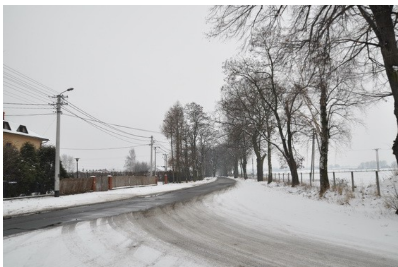
Ilustracja 13: Rudoltowice - widok ogólny.