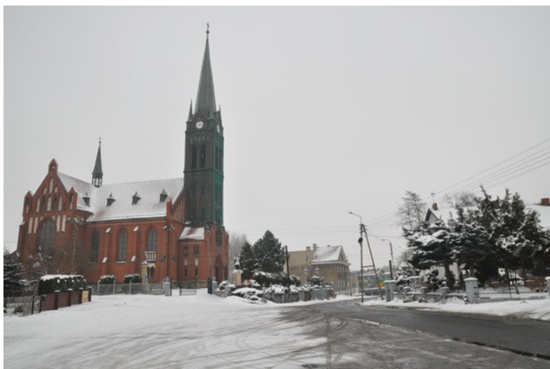
Ilustracja 6: Brzeźce - centrum.