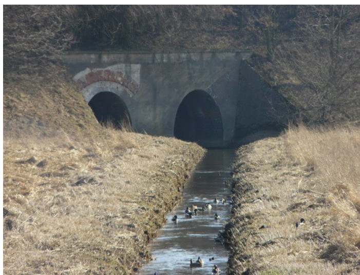
Ilustracja 19: Piasek - przepust wodny na Dokawie

Po I wojnie światowej, w skutek plebiscytu Pszczyna została przyłączona do Polski. Zachowała swój charakter centrum okręgu rolniczo – hodowlanego, stając się również ważnym ośrodkiem turystycznym. W mieście powstawały niewielkie zakłady przemysłu rolno – spożywczego (mleczarnie, młyny przetwórcze). W latach 1936 – 39 powstała druga linia kolejowa, łącząca Pszczynę z Rybnikiem.