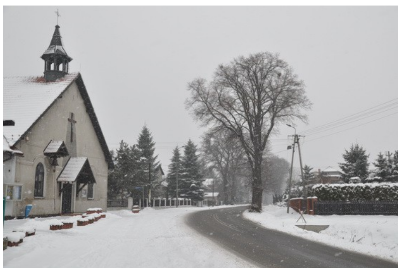
Ilustracja 7: Czarków - widok ogólny.