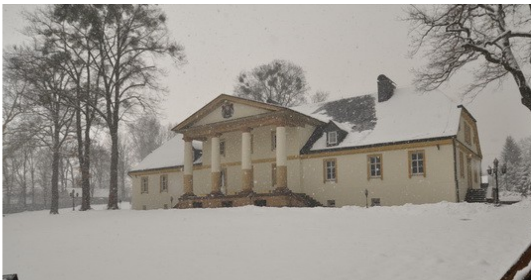
Ilustracja 5: "Ludwikówka"

użyteczności publicznej, mieszczące się w tej dzielnicy (np. siedziba starostwa) – mają charakter willi położonych w ogrodzie. Układ dzielnicy, pomimo licznych zmian i przekształceń, obecnie jest nadal czytelny.