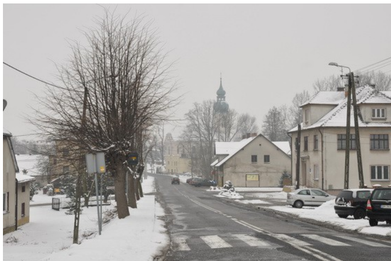
Ilustracja 15: Studzionka - widok ogólny.