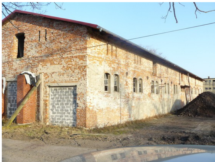
Ilustracja 21: Folwark Stenclówka - budynek dawnej stajni.