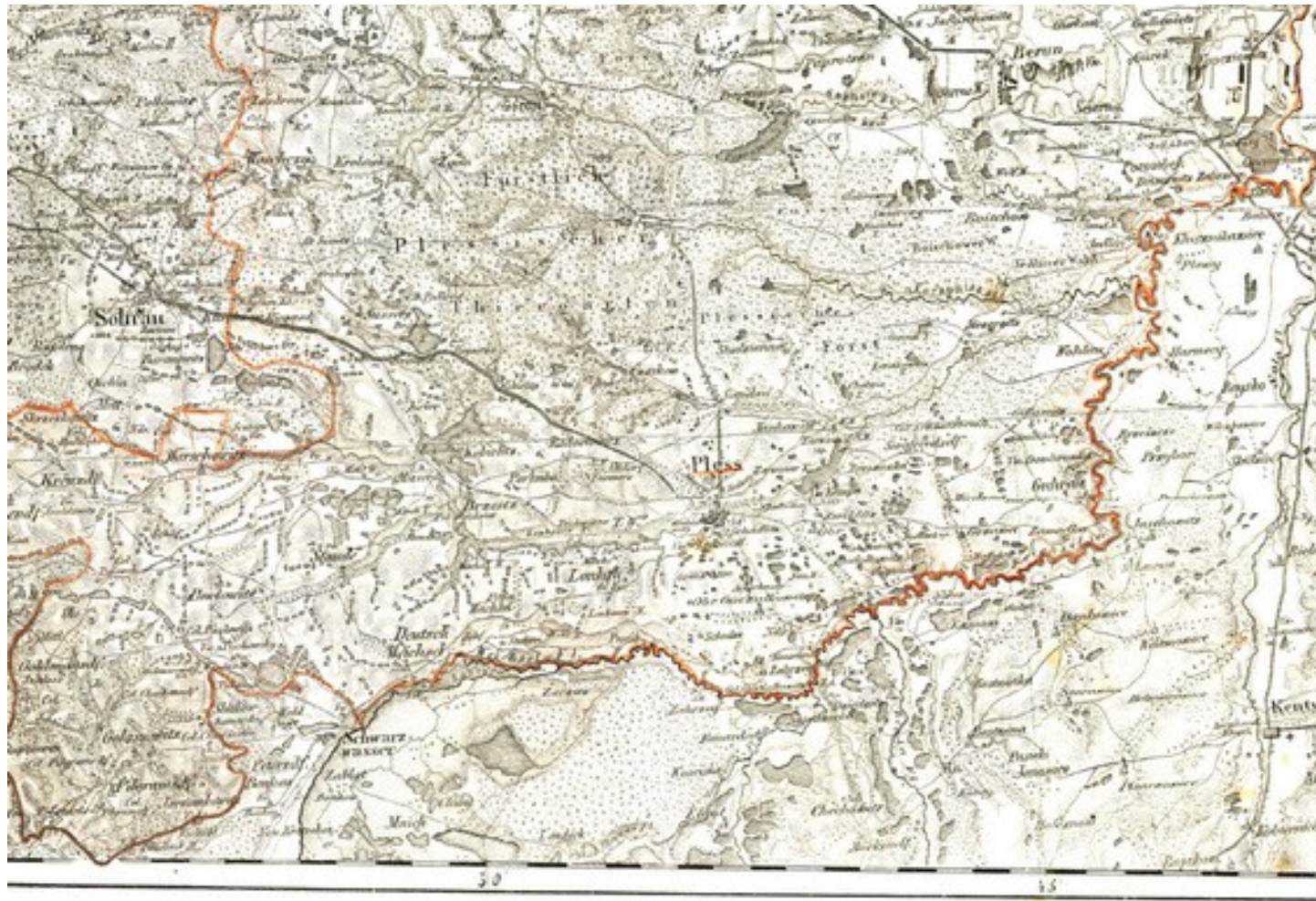
Ilustracja 3: Kreis Pless 1:150000