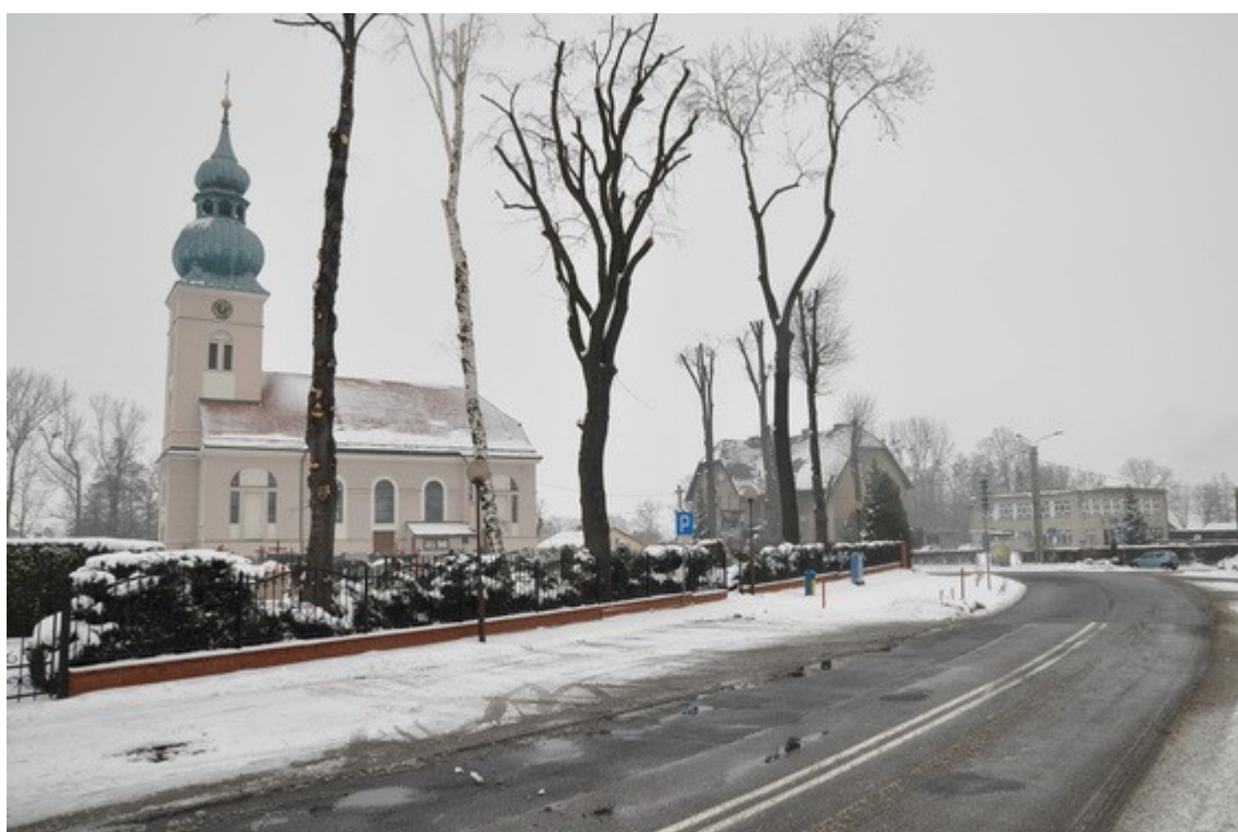
Ilustracja 30: Studzionka - kościół

W latach 1907-1909 powstał neogotycki kościół p. w. Matki Boskiej Szkaplerznej w Brzeźcach. Budowla ta, powstała staraniem miejscowej ludności na miejscu wcześniejszego, drewnianego kościółka. Na rzucie krzyża łacińskiego, trójnawowa bazylika z transeptem i wielobocznie zamkniętym prezbiterium. Od zachodu kruchta z wieżą. Wystrój neogotycki i neobarokowy.