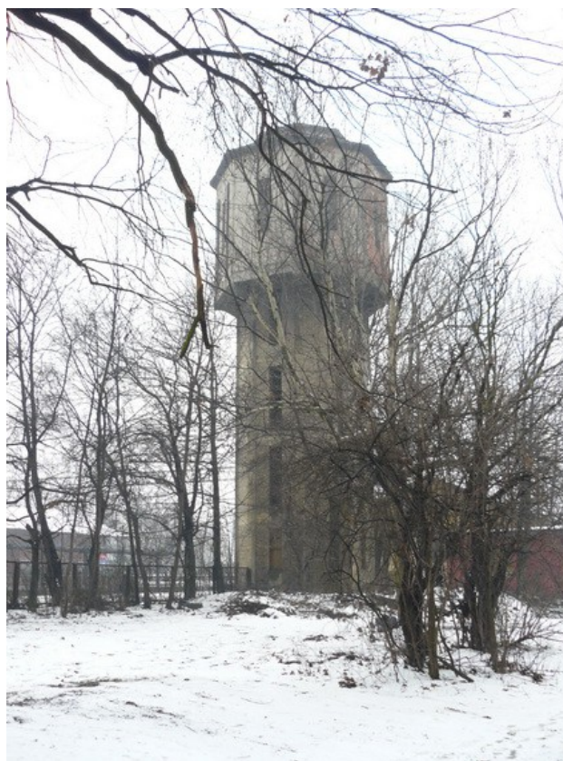
Ilustracja 27: Pszczyna - wieża wodna przy zespole dworcowym.

W XIX w. wraz z rozwojem techniki wzniesiono pojedyncze obiekty przemysłowe, związane głównie z rozbudową linii kolejowej (np. zespół zabudowy dawnego dworca kolejowego w Pszczynie przy placu Dworcowym, mosty kolejowe nad rzeką Pszczynką, Dokawą), ale również niewielkie zakłady przemysłu rolno – spożywczego (zespół zabudowy dawnego Młyna parowego w Pszczynie przy ul. Dworcowej 7, browar, gorzelnia oraz budynki dawnej cukrowni przy ul. Wojska Polskiego oraz Młyńskiej w Pszczynie, zespół zabudowy rzeźni miejskiej oraz magazyny i budynki wytwórni wód gazowanych, przy ul. Korczaka w Pszczynie, zespół budynków mleczarni przy ul. Męczenników Oświęcimia 1 w Pszczynie).