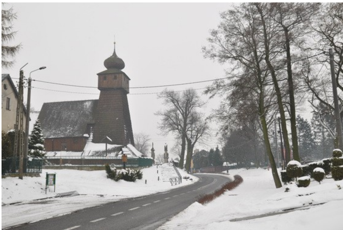
Ilustracja 29: Wisła Mała - kościół

Bryłę opinają soboty. Kościół był rozbudowywany w latach 20. XX w. i wówczas najprawdopodobniej, uzyskała swoją formę wieża. W jednonawowym wnętrzu zachowało się barokowe wyposażenie.