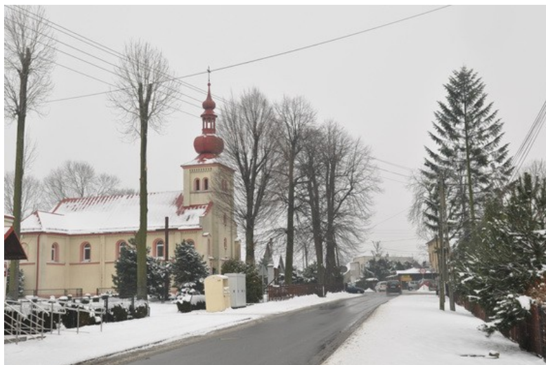
Ilustracja 17: Wisła Wielka - widok na kościół.