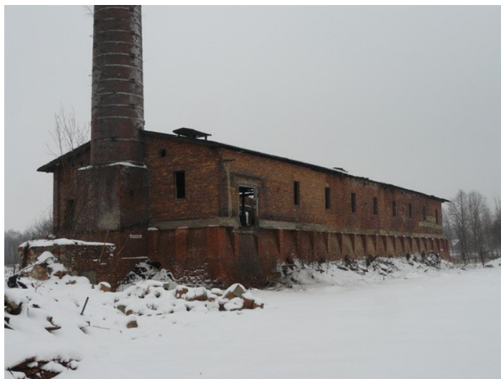
Ilustracja 18: Poręba - dawna cegielnia przy ul. Cegielnianej.