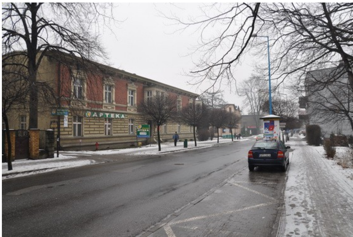
Ilustracja 28: Pszczyna - ul. Dworcowa

Pszczyna jako centrum administracyjne dominium książęcego, a później starostwa ziemskiego, posiadała wiele budynków związanych z administracją dobrami książęcymi oraz władzą cywilną i sądownictwem. Wszystkie tego typu obiekty użyteczności publicznej zlokalizowano w obrębie miasta Pszczyna i posiadają do dziś bardzo wysokie walory zabytkowe. Do unikatów należą: