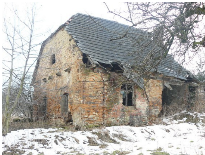
Ilustracja 22: Rudoltowice - dawna kuźnia dworska.