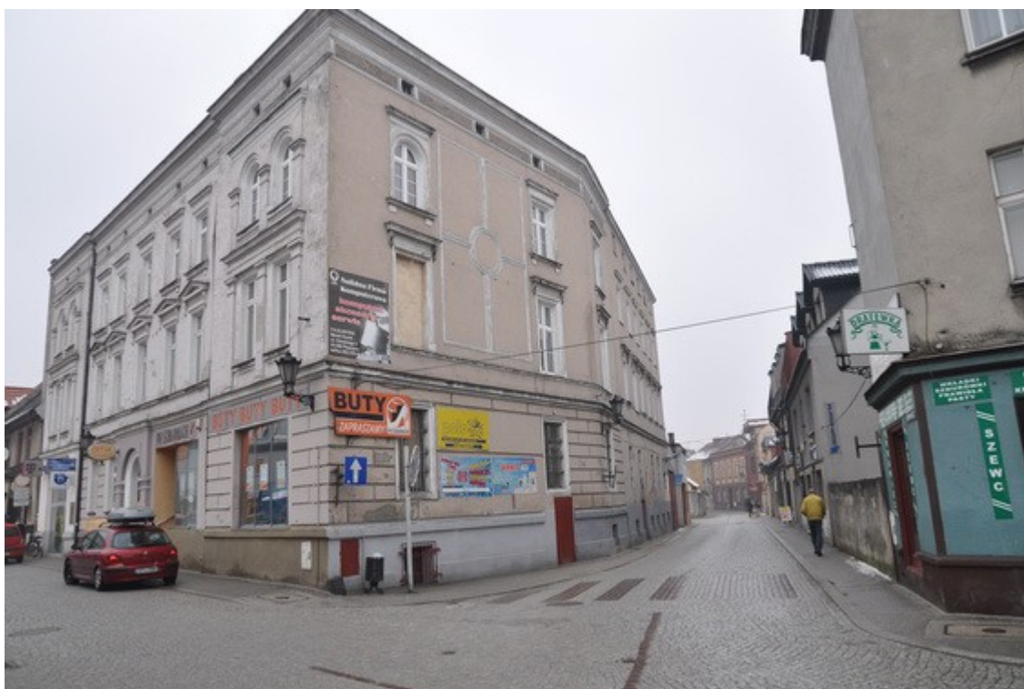
Ilustracja 25: Pszczyna - ul. B. Chrobrego i Warowna

Pierwotnie tylko przy rynku mogły mieścić się kamienice, czyli budynki, których parter zajmowały lokale użytkowe (najczęściej handlowe), zaś piętra miały charakter mieszkalny. W przypadku Pszczyny murowane kamienice powstawały przy Rynku od połowy XVIII w. Najstarsze zachowały formę klasycystyczną oraz w znacznej większości detale architektoniczne (Rynek 3, 5, 6, 8, 9, 10, 11, 12, 15, 16, 17, 18, 19, 20). W kilku przypadkach detale architektoniczne się nie zachowały (Rynek 4, 13 i 14).