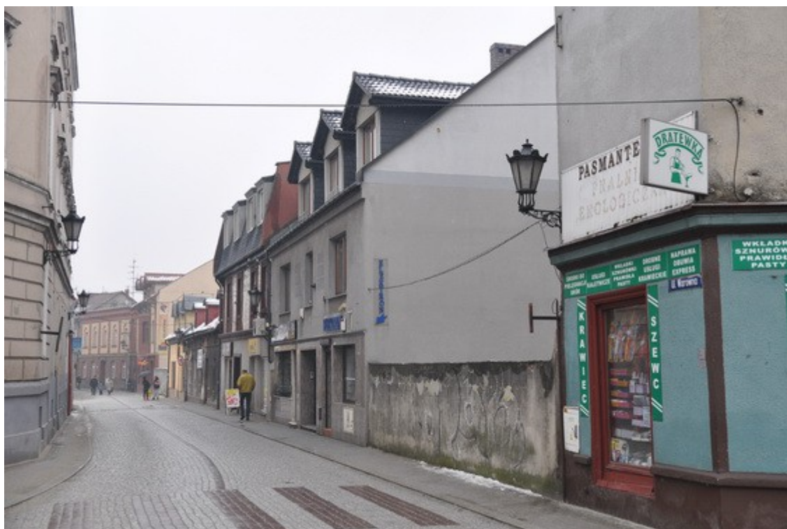
Ilustracja 26: Pszczyzna - ul. Warowna

Zupełnie niepowtarzalnym, zatem tym cenniejszym elementem urbanistyki Pszczyzny, jest tak zwana dzielnica XIX -wieczna. Jak już wspomniano w niniejszym opracowaniu, pod koniec XIX w. ogrodnik książęcy, H. Bolecke utworzył plany dzielnicy z centralnym siedmiobocznym placem oraz regularnym, promienistym układem ulic, podzielonych na prostokątne parcele prostopadłe do ulic,