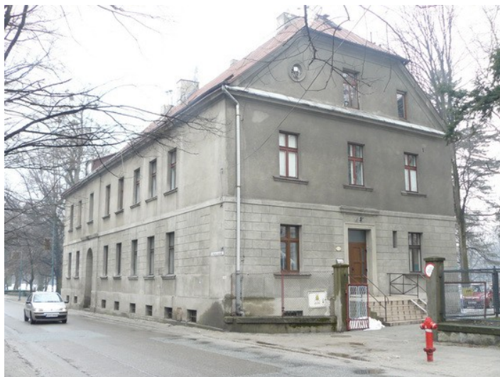
Ilustracja 20: Pszczyna - ul. Wojska Polskiego 2 – dawny Zarząd Dóbr Królewskich.