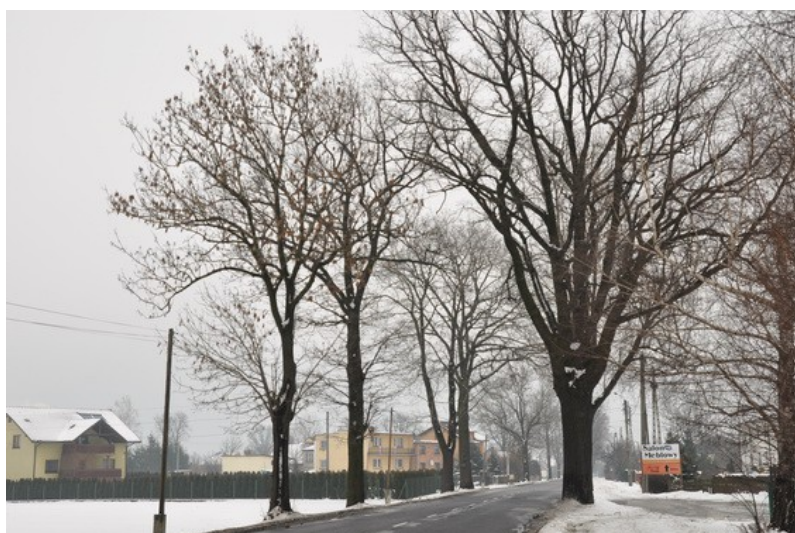
Ilustracja 10: Jankowice - widok ogólny.