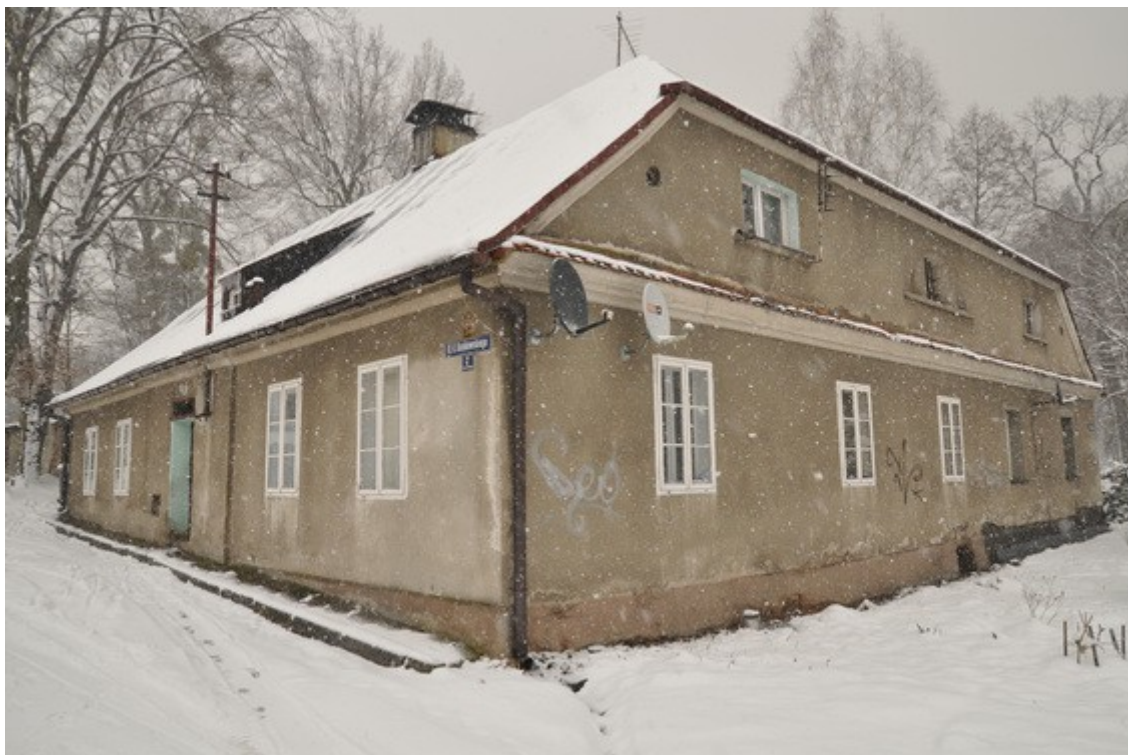
Ilustracja 24: Pszczyna - ul. Dunikowskiego