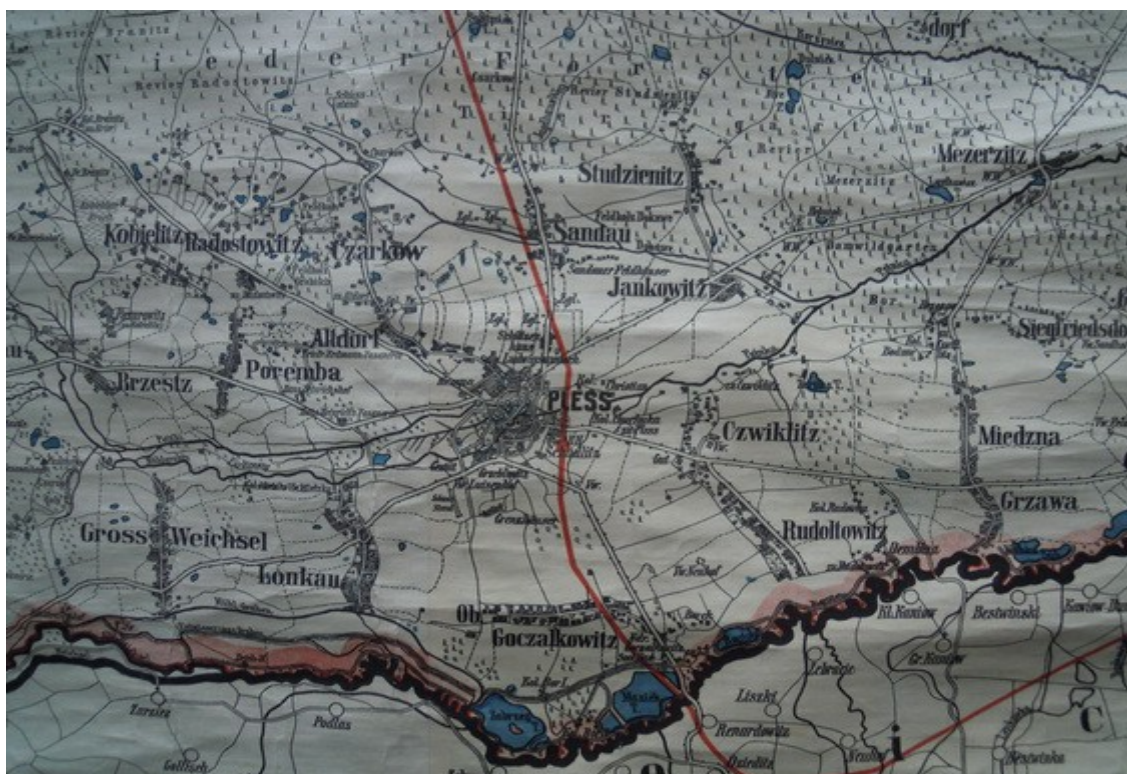
Ilustracja 2: Mapa ścienna "Der Kreis Pless für Schule"

Gmina Pszczyzna położona jest na południu województwa śląskiego i w południowej części powiatu pszczyńskiego. Jest gminą miejsko – wiejską, tworzą ją miasto Pszczyzna oraz sołectwa: Brzeźce, Czarków, Ćwiklice, Jankowice, Łąka, Poręba, Piasek, Rudolftowice, Studzienice, Studzionka, Wisła Mała i Wisła Wielka.