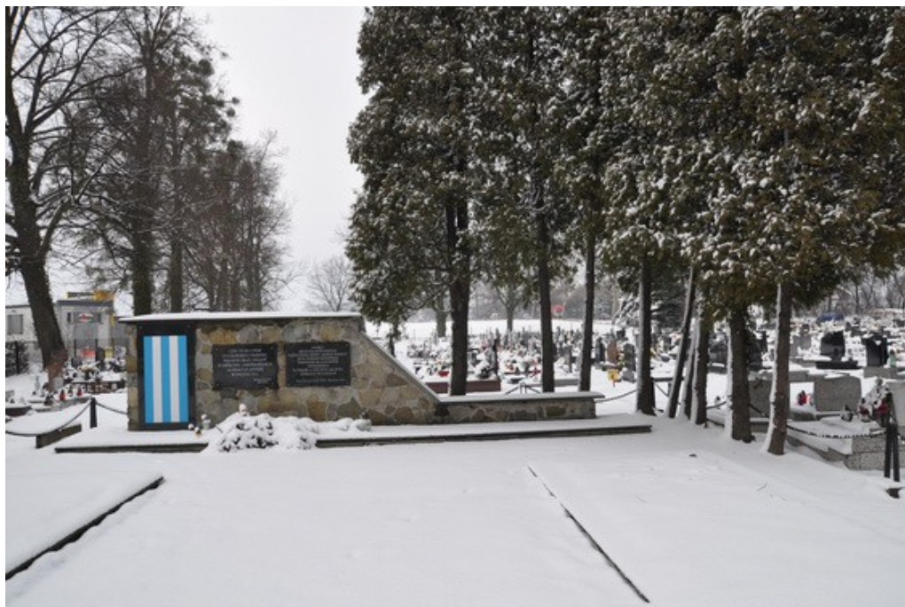
Ilustracja 31: Pszczyna - cmentarz wojenny.