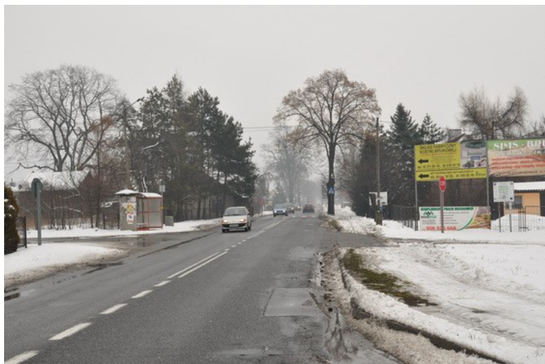
Ilustracja 9: Jankowice - widok ogólny.