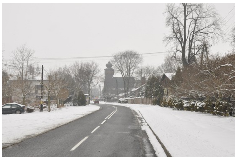
Ilustracja 16: Wisła Mała - widok ogólny.