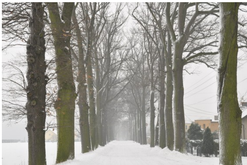
Ilustracja 12: Poręba - ul. Barbórki.