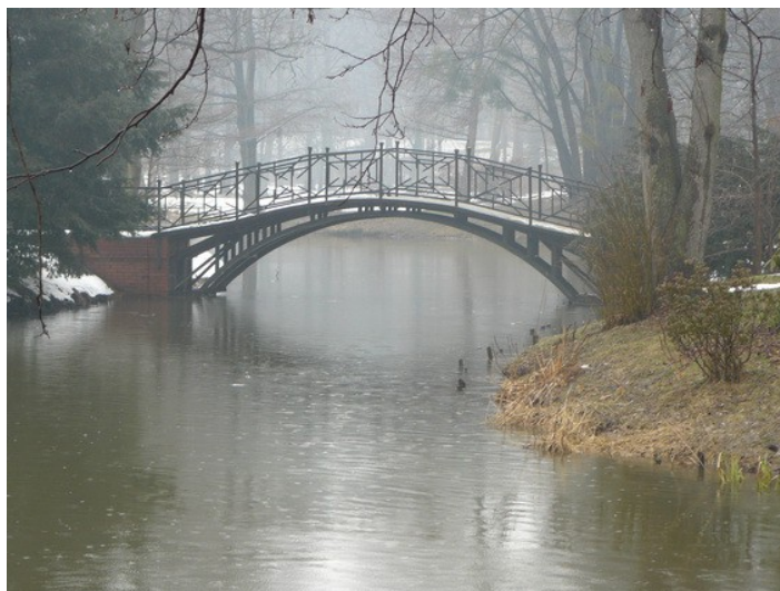
Ilustracja 23: Pszczyna - pałacowy mostek łukowy.

Podobne, jak w kompozycji parków tendencje, rządziły w XIX i na początku XX w. układami zieleni cmentarnej w gminie Pszczyna. Zasadniczo cmentarze komponowano ze szpalerami obwodowymi, granicznymi, złożonymi głównie z lip drobnolistnych Tilia cordata jak w przypadku cmentarza przykościelnego w Ćwiklicach oraz dębów szypułkowych Quercus robur , jak na Cmentarzu w Wiśle Małej. W niektórych przypadkach kompozycję wzbogacano gatunkami egzotycznymi drzew i krzewów. Przykładami takich kompozycji są oba cmentarze wyznaniowe przy ulicy Katowickiej. W późniejszych latach tj. w drugiej połowie XX oraz na początku XXI w. kompozycje ubożeją cmentarze – parki przekształcają się w nekropolie obsadzone jedynie obwodowo krzewami zimozielonymi, głównie żywotnikami zachodnimi Thuja occidentalis , jak to widzimy w przypadku cmentarza ewangelickiego w Studzionce.