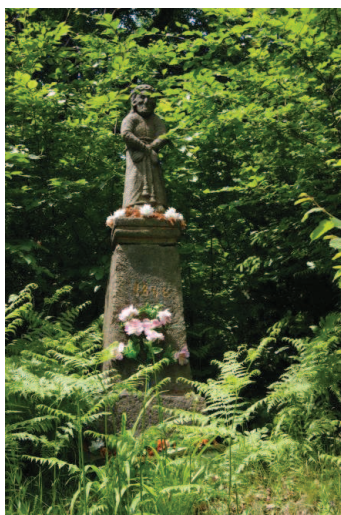
Łysina, figura kamienna Jezusa „Ecce Homo”, 1843r.

Kocierz Moszczanicki, kapliczka słupowa, szafkowa z kamienia piaskowego, ul. Beskidzka, 1775r.