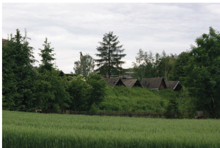
Zespół 7 piwnic kamiennych Łękawica ul. Za Wodą/ul. Kalinowa