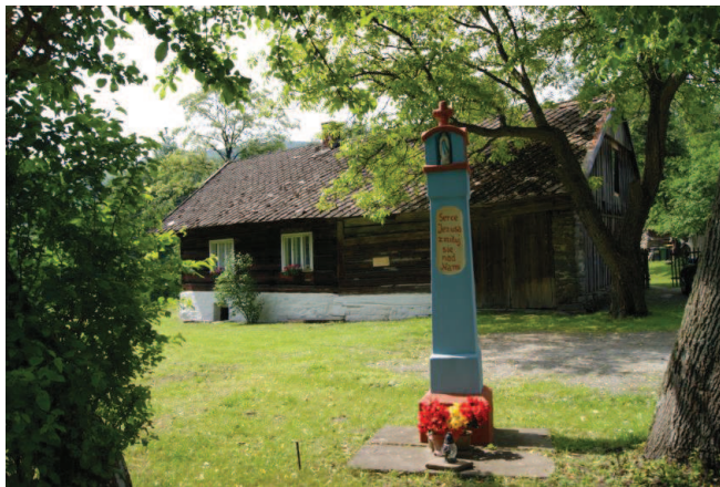
Kocierz Moszczanicki, ul. Beskidzka 81, dom z kapliczką kam. w obrębie posesji, kon. XIXw.