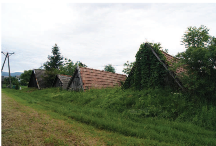
Zespół 5 piwnic kamiennych Łękawica ul. Ojca Michała

Łękawica - zespół 5 piwnic kamiennych zadaszonych daszkami konstrukcji drewnianej, ul. Ojca Michała, zespół 7 piwnic kamiennych ul. Za Wodą/ul. Kalinowa. Zespół piwnic stanowi cenny i unikalny przykład tego typu zabudowań gospodarczych. Obiekty w większości są nieużytkowane i popadają w ruinę. Program obejmuje inicjowanie działań zmierzających do ich rewitalizacji (ewentualne wprowadzenie zastępczej funkcji użytkowej, np. rezerwatu kulturowego, z włączeniem obiektów do programów imprez kulturalnych, programów zwiedzania, oraz do szlaków turystycznych i tras rowerowych), konserwacji i restauracji polegającej na naprawie elementów niesprawnych i zabezpieczeniu obiektów z zachowaniem ich dotychczasowej formy.