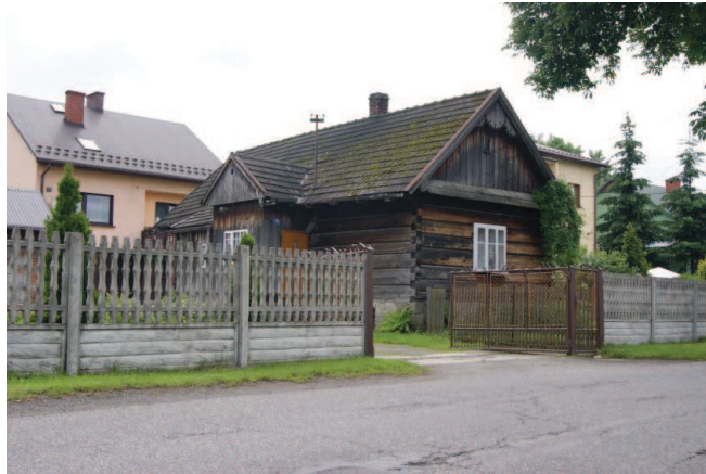
Łękawica, dom drewn. zrębowy ul. Wspólna 49A, ok. 1930r.