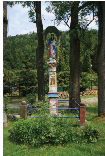
Kocierz Moszczanicki, Figura MB