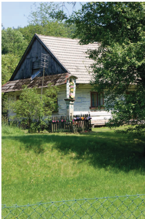
Kocierz Rychwałdzki, dom drewniano-kamienny z kapliczką, ul. Turystyczna 25, kon. XIXw.

Łękawica, ul. Brzozowa 5, „Willa Sitajka” 1 ćw. XXw.