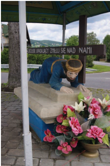
Łękawica, kapliczka „Upadek Chrystusa pod krzyżem” Różańcowej